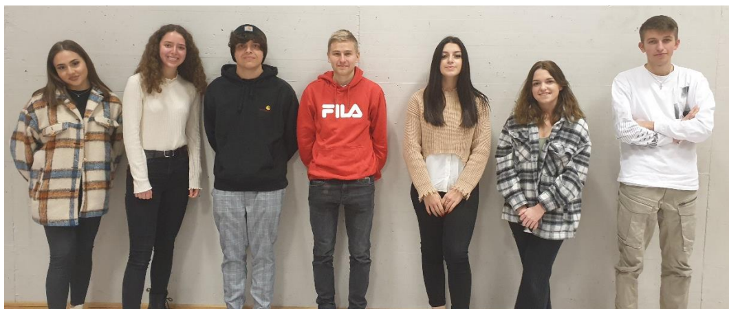
Présents lors de l'Assemblée communale du 15.12.2020 (de gauche à droite) :