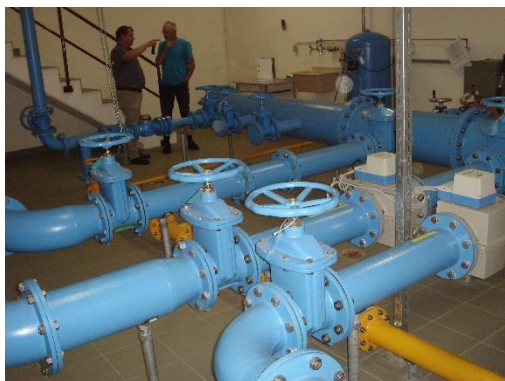
Réservoir Wilerholz, Morat : Installation de conduites existantes. Ici, l'installation d'une station de pompage à gradins est prévue.

D'autres mesures comprennent une liaison supplémentaire pour l'alimentation de Villars-les-Moines, une extension du réseau à Courgevaux, des chambres pour la réduction de pression à Burg et à Altavilla, et autres.