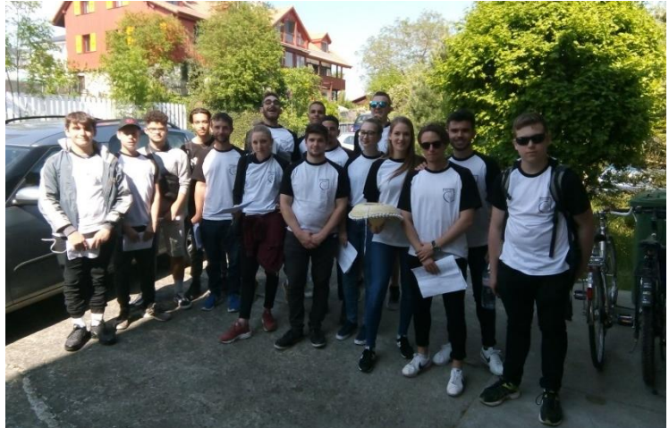
Chant du 1 er mai

Les activités 2018 de la société de Jeunesse :