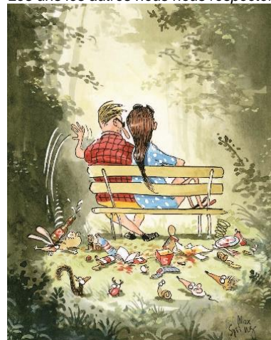
Ni traces ni déchets, nous ne laisserons